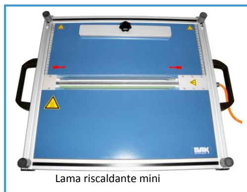
Lama riscaldante mini