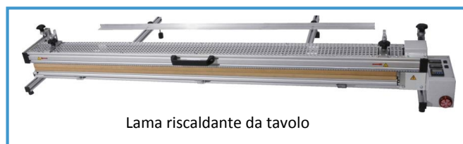
Lama riscaldante da tavolo